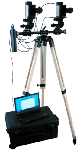
Abb. ROMEG M 20 G Die Abbildung zeigt ein Mustersystem. Der Lieferumfang kann von der obigen Darstellung abweichen.